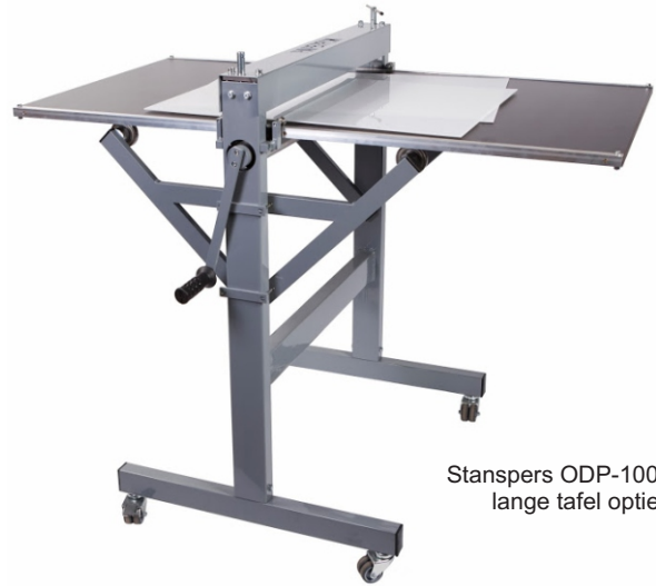
Stanspers ODP-100 met lange tafel optie

De ODP-100 stanspers kan papier, karton PVC, leder, kurk, schuim en andere kunstmatige stoffen snijden, rillen en perforeren. Dit gebeurt door middel van op maat gemaakte uitkapvormen (stansvormen). Het te snijden materiaal wordt op de stansvorm geplaatst met een tegenplaat erboven waarop de snijmesses gaan belanden. Het geheel wordt dan door de aandrukrollen van de stanspers gevoerd. Het snijden gebeurt door de aandruk van de rollen. De mobiele tafel verschuift automatisch bij het draaien van de hendel.