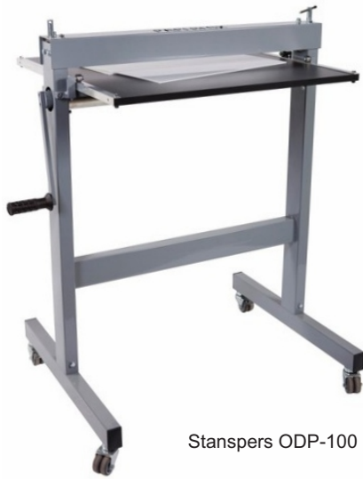
Stanspers ODP-100 (basisversie)